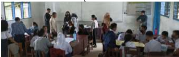
Gambar 4. Aktivitas Belajar Mandiri oleh Ssiswa