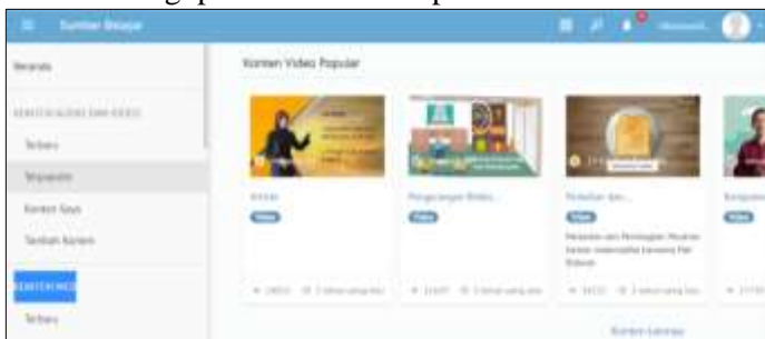
Gambar 5. Media Belajar Online “Rumah Belajar”