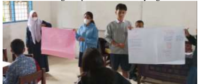
Gambar 2. Presentasi Siswa di Kelas