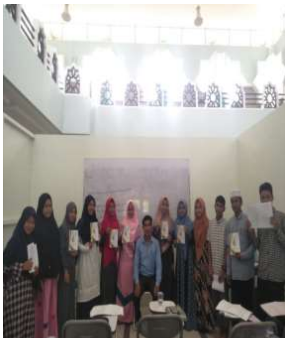
Gambar 3. Sosialisasi Produk Katalog Literatur dengan Mahasiswa

Dalam Pelaksanaanya, Pengabdian ini juga melakukan evaluasi dari hasil kegiatan sebagai berikut: