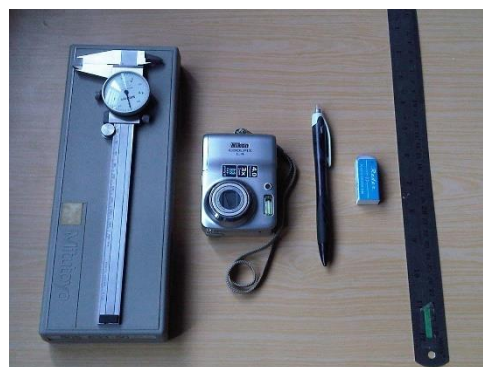
Gambar 1. Alat yang digunakan dalam penelitian

dengan ketepatan dua angka di belakang koma untuk pengukuran lebar mesio-distal materi gigi, lebar antarkaninus, lebar antarmolar, panjang lengkung, dan perimeter lengkung, Kamera digital merk Nikon COOLPIX L4, Pensil 2B merk Faber-Castell untuk penandaan titik kontak gigi pada model, Penghapus, Penggaris besi.