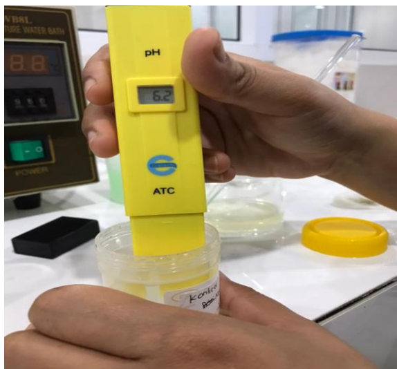
Gambar 2. Hasil uji PH pada F0 (Kontrol negative)