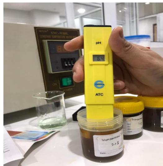
Gambar 3. Hasil uji PH pada F1 (EBK)