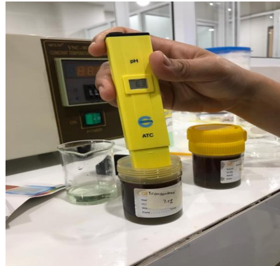
Gambar 5. Hasil uji PH pada F3 (EBK)