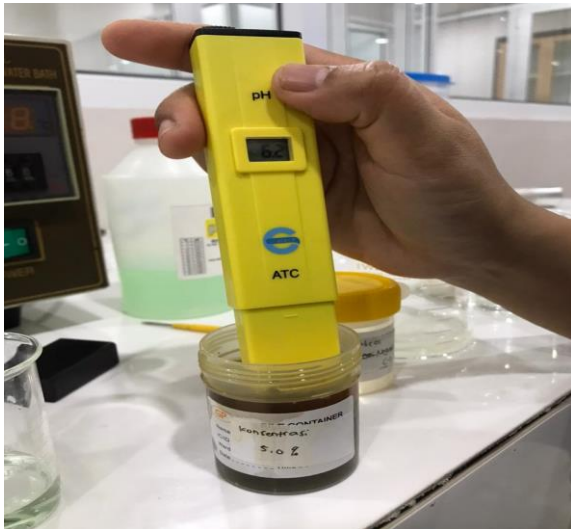
Gambar 4. Hasil uji PH pada F2 (EBK)