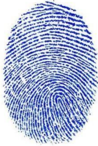
Gambar 3. Citra Sidik Jari Warna

menjadi citra biner untuk dapat diterapkan kedalam metode peceptron. Sebagai contoh kasus pengenalan sidik jari seperti pada gambar dibawah ini: