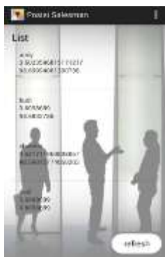
Gambar 7. Tampilan Menu List Posisi

g. Tampilan Menu List Posisi Pada tampilan list posisi menampilkan tampilan pada saat supervisor memilih tombol posisi Tampilan Menu List Posisi tampak pada gambar 7 berikut.