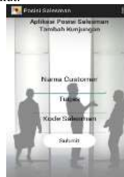
Gambar 4. Tampilan Menu Tambah Kunjungan

Tampilan Menu Tambah Kunjungan tampak pada gambar 4 berikut.