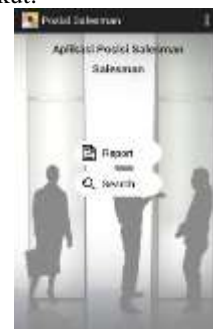
Gambar 11. Tampilan Menu Salesman

Tampilan Menu Pilihan Salesman tampak pada gambar 11 berikut.