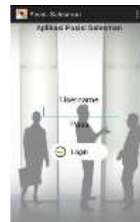
Gambar 10. Tampilan Menu Login.

Tampilan Menu Login tampak pada gambar 10 berikut.