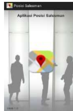
Gambar 9. Tampilan Menu Awal

Pada tampilan awal menampilkan tampilan pada saat awal aplikasi diakses. Tampilan Menu Awal tampak pada gambar 9 berikut.