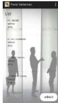
Gambar 14. Tampilan List Report

Tampilan Menu List Report tampak pada gambar 14 berikut.