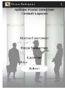
Gambar 13. Tampilan Tambah Report