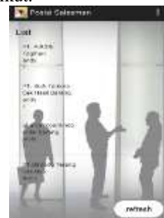
Gambar 12. Tampilan List Kunjungan

Tampilan Menu List Kunjungan tampak pada gambar 12 berikut.