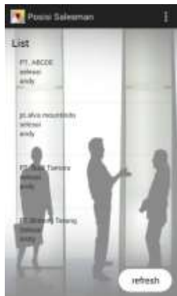
Gambar 6. Tampilan Menu List Report

f. Tampilan Menu List Report Tampilan Menu List Report tampak pada gambar 6 berikut.