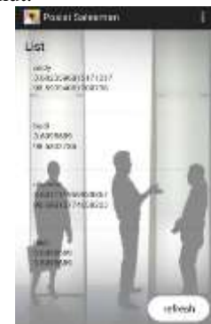
Gambar 5. Tampilan Menu List Kunjungan.

Tampilan Menu List Kunjungan tampak pada gambar 5 berikut.