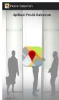
Gambar 1. Tampilan Menu Awal

Tampilan Menu Awal tampak pada gambar 1 berikut.