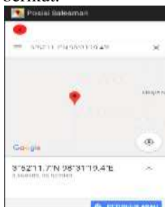
Gambar 8. Tampilan Posisi Salesman

h. Tampilan Menu Posisi Salesman Pada tampilan posisi salesman menampilkan tampilan pada saat supervisor memilih tombol salesman Tampilan Menu Posisi Salesman tampak pada gambar 8 berikut.