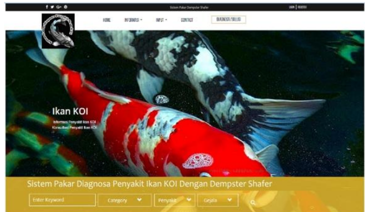
Gambar 1. Halaman Beranda

Untuk memudahkan dalam memahami logika sistem pakar ini dalam menggunakan penggunaan aplikasi sistem pakar maka dibangunlah sebuah sistem pakar diagnosis penyakit ikan koi menggunakan metode Dempster Shafer sebagai proses perhitungan nilai kepastian terjadinya penyakit. User dapat melakukan diagnosa dengan memilih gejala – gejala yang dialami ikan koi. Adapun 5 menu dari sistem diagnosis penyakit ikan koi ini yaitu menu home, informasi (penyakit,gejala,dll), input, diagnosa dan contact. Menu home sebagai tampilan utama pada sistem pakar ikan koi ini.