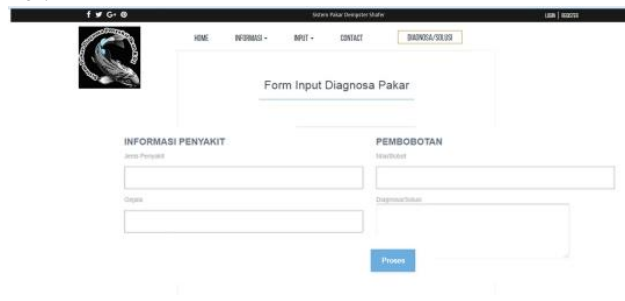
Gambar 2. Halaman Diagnosa Pakar

Pada menu beranda berisikan tampilan informasi mengenai ikan koi, jenis penyakit, gejala-gejala dan seluruh informasi yang bersangkutan mengenai ikan koi.