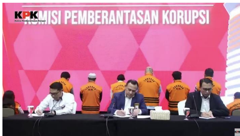
Gambar 2. Korupsi Oleh ASN Ditjen Minerba

Akibat dari tindakan tersebut, tunjangan yang seharusnya dibayarkan sebesar Rp1.399.928.153, dibayarkan sebesar Rp29.603.277.720 sehingga negara mengalami kerugian sekurangnya Rp27,6 miliar. Atas perbuatannya, para tersangka melanggar pasal 2 ayat (1) atau pasal 3 UU RI No.20 Tahun 2001. KPK menyampaikan apresiasi dan terima kasih kepada masyarakat dan semua pihak yang telah mendukung proses penanganan perkara ini. KPK juga mengingatkan bahwa setiap gaji yang diterima oleh seorang ASN adalah hasil keringat rakyat Indonesia. Penggunaannya harus sesuai dengan peraturan dan prosedur yang berlaku dan dapat dipertanggungjawabkan.