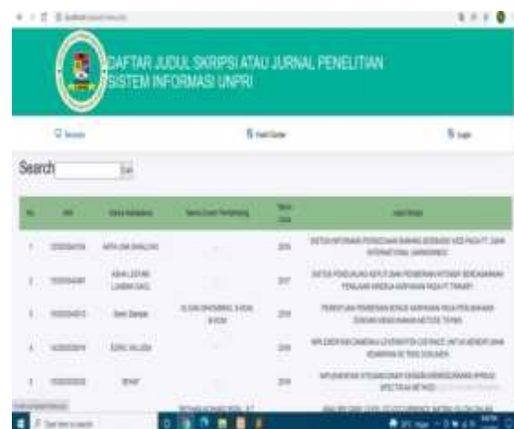
Gambar 3. Halaman Utama

Pada Sistem Penerapan data mining menggunakan algoritma K-Means untuk menentukan judul skripsi dan jurnal penelitian terdapat beberapa bagian menu yaitu tampilan judul skripsi hanya dapat dilihat oleh pengunjung.