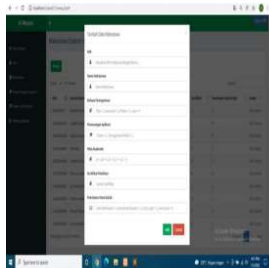
Gambar 5. Halaman Data Mahasiswa