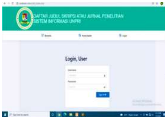
Gambar 4. Login User

melihat hasil cluster dihalaman web. Sehingga untuk melihat hasil clusternya, user dapat melihatnya diweb, dengan login dengan username dan password yg diberikan oleh admin.