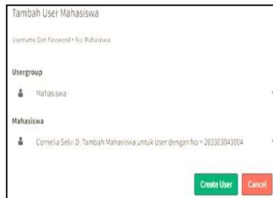
Gambar 6. Halaman Tambah User Mahasiswa